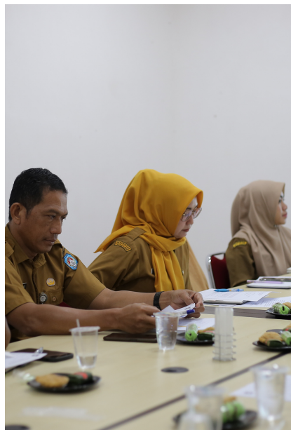
Pengukuran Indeks Pengelolaan Keuangan Daerah (IPKD) Kabupaten Kubu Raya