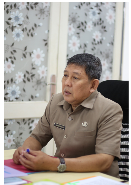
Indeks Indeks Prioritas Kabupaten Kubu Raya