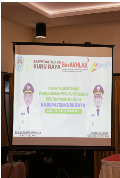
Rakor Pembahasan Petunjuk Teknis Kelitbangan Daerah Kabupaten Kubu Raya