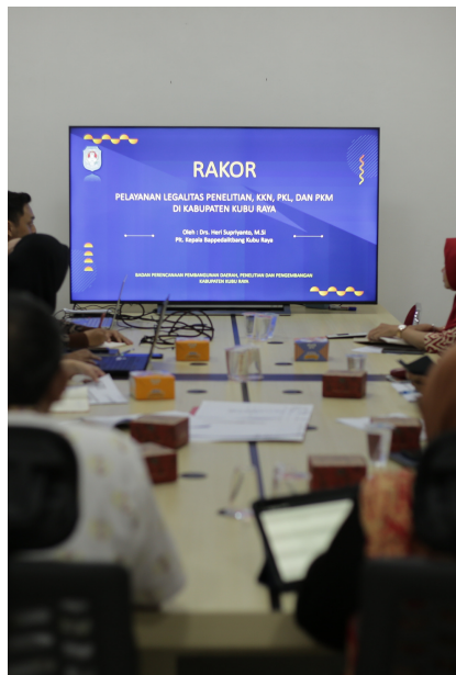
Prosedur Penyelenggaraan Penelitian Kabupaten Kubu Raya