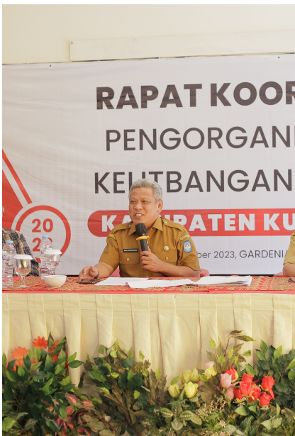
Rakor Pengorganisasian Kelitbangan Daerah Kabupaten Kubu Raya