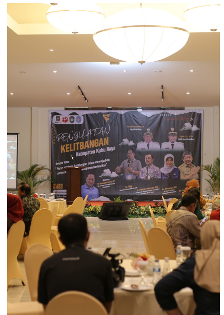
Penguatan Kelitbangan Daerah Kabupaten Kubu Raya